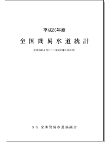
『全国簡易水道統計』