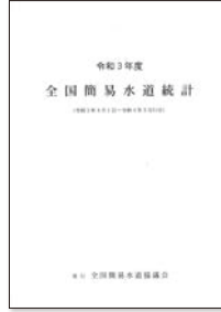
全国簡易水道統計