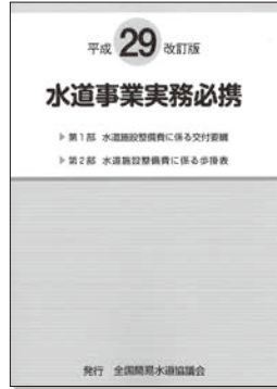
「水道事業実務必携」