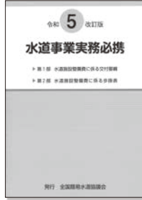
水道事業実務必携