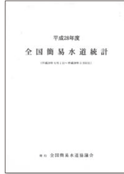
「全国簡易水道統計」