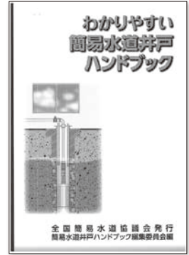
「わかりやすい簡易水道井戸ハンドブック」